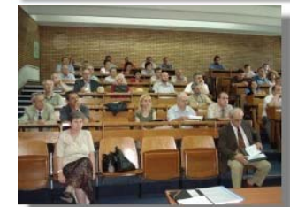
Imagini surprinse în timpul manifestării